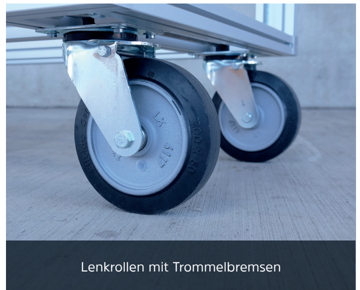
Lenkrollen mit Trommelbremsen

Der Rollcontainer kann entweder komplett montiert oder als Bausatz zur Eigenmontage geliefert werden.