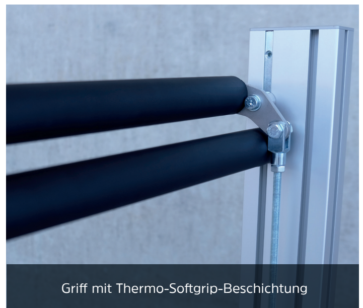
Griff mit Thermo-Softgrip-Beschichtung